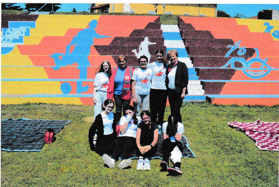
Pomladak HCK s voditeljima