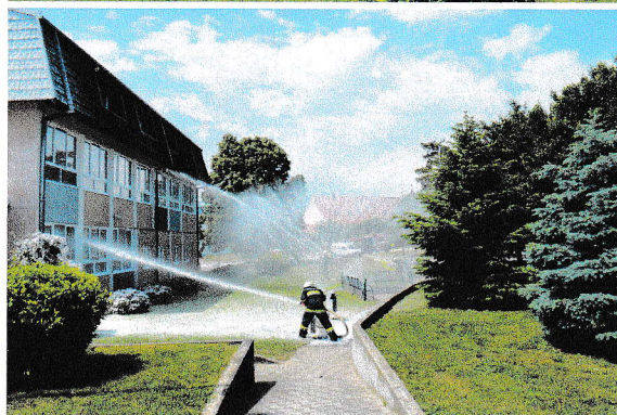
Dolazak DVD Molve i simulacija gašenja požara vodom i pjenom