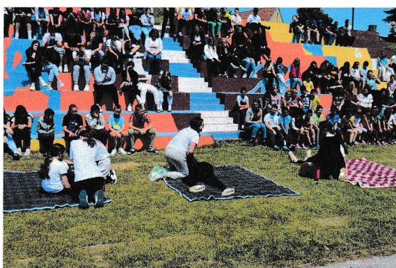
Simulacija pružanja prve pomoći pomlatka HCK