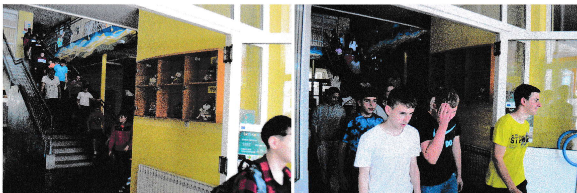
Evakuacija učenika i djelatnika OŠ Molve