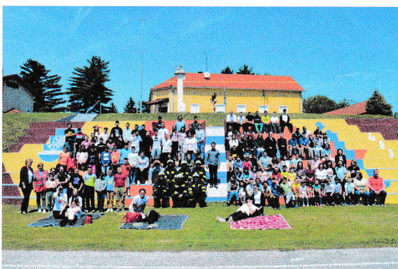
Sudionici vježbe evakuacije i spašavanja OŠ Molve