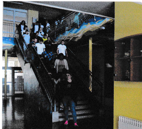
Evakuacija učenika i djelatnika OŠ Molve