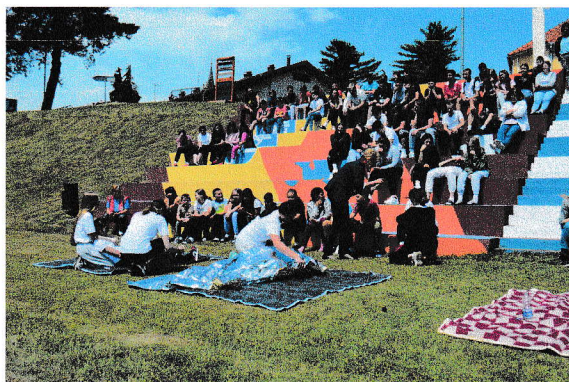
Dolazak učenika i radnika na zbrno mjesto, simulacija pružanja prve pomoći pomlatka HCK